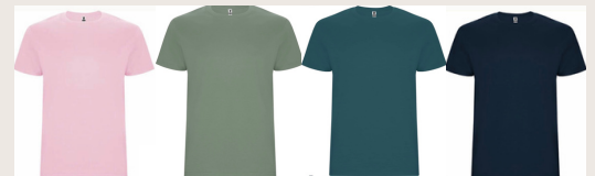
7 / 8